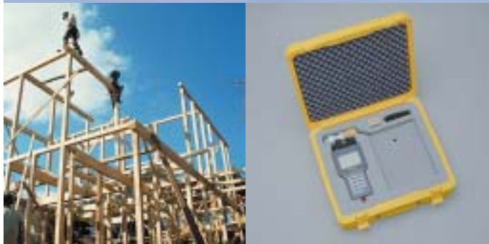
キャリングケース